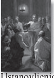
Ustanovljenje sv. Euharistije