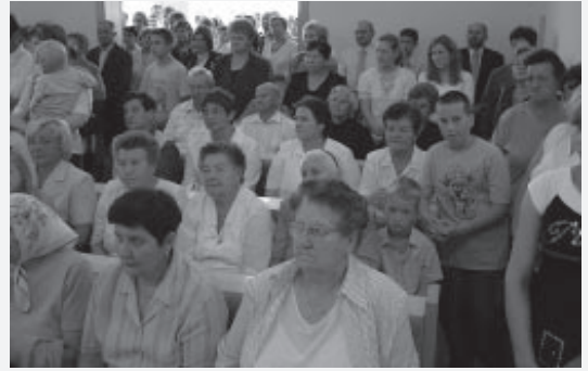
U Donjem Pustakovcu 22.8.2005. proslavljeno je prvo proštenje BDM Kraljice.